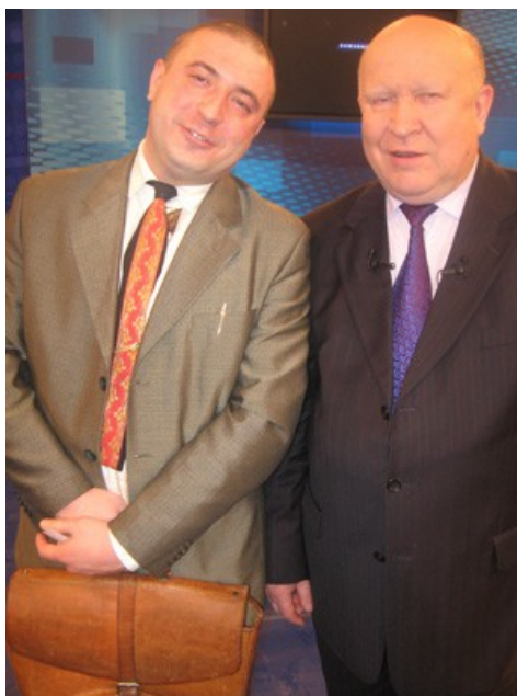
Видеокартина «Государь и милостевый государь, или наше всё»

http://shantsevvp.livejournal.com/43330.html? thread=586306#t586306