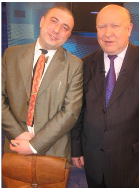
Видеокартина «Государь и милостевый государь»

http://shantsevvp.livejournal.com/43330.html?thread=586306#t5863